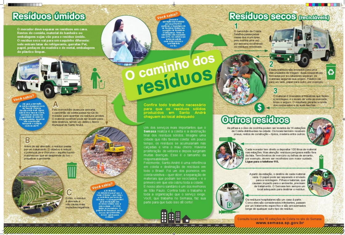
Figura 1 – O caminho dos resíduos