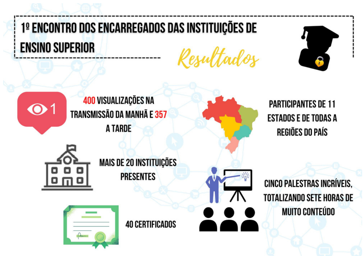
Figura 04: Resultados do 1º Encontro dos Encarregados das Instituições de Ensino Superior