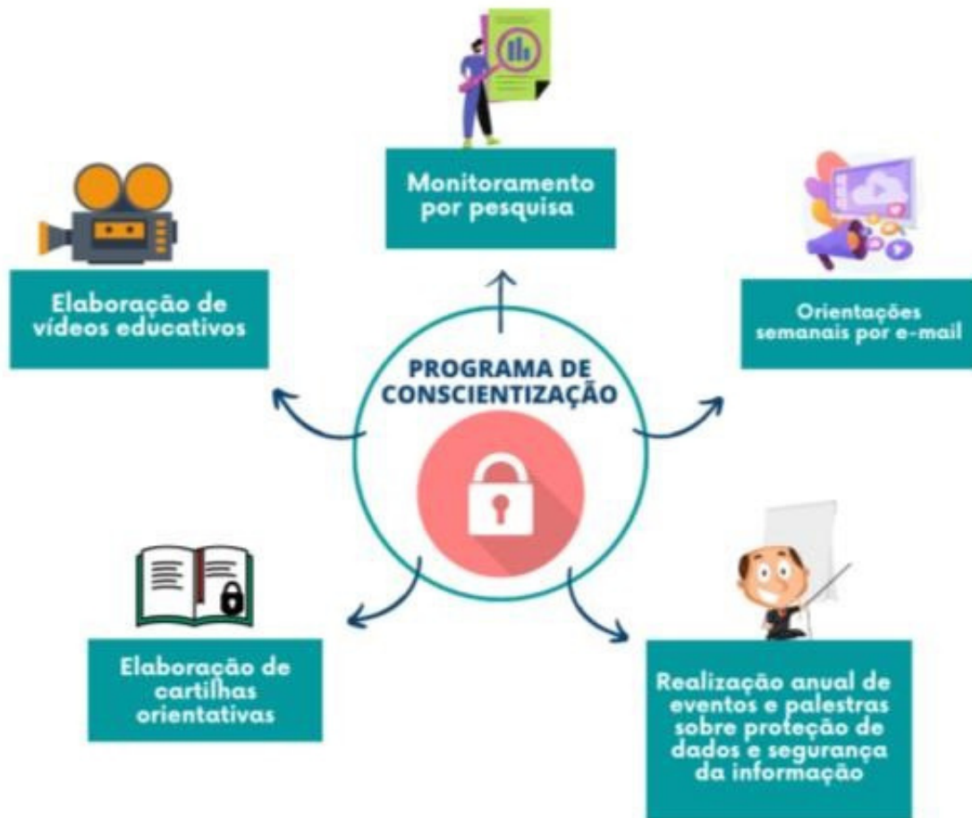
Figura 02: Programa de Conscientização.