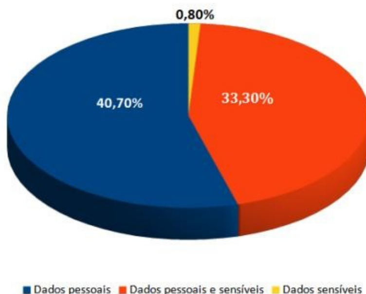
Gráfico 02: Resultado da 2ª pesquisa de tratamento de dados/ tipo de coleta de dados

A segunda pesquisa demonstrou que 85,4% dos respondentes têm conhecimento da LGPD, 42,3% realizaram algum treinamento ou capacitação em LGPD, 62,6% aplicam as normas e diretrizes presentes na LGPD em seu ambiente de trabalho. Em relação a coleta de dados pessoais e/ou sensíveis, 40,7% coletam apenas dados pessoais em sua atividade no trabalho, 33,3% coletam dados pessoais e sensíveis em sua atividade no trabalho, 23,6% não realizam coleta de dados pessoais e sensíveis, 0,8% coletam apenas dados sensíveis, conforme demonstrado graficamente no Gráfico 02.