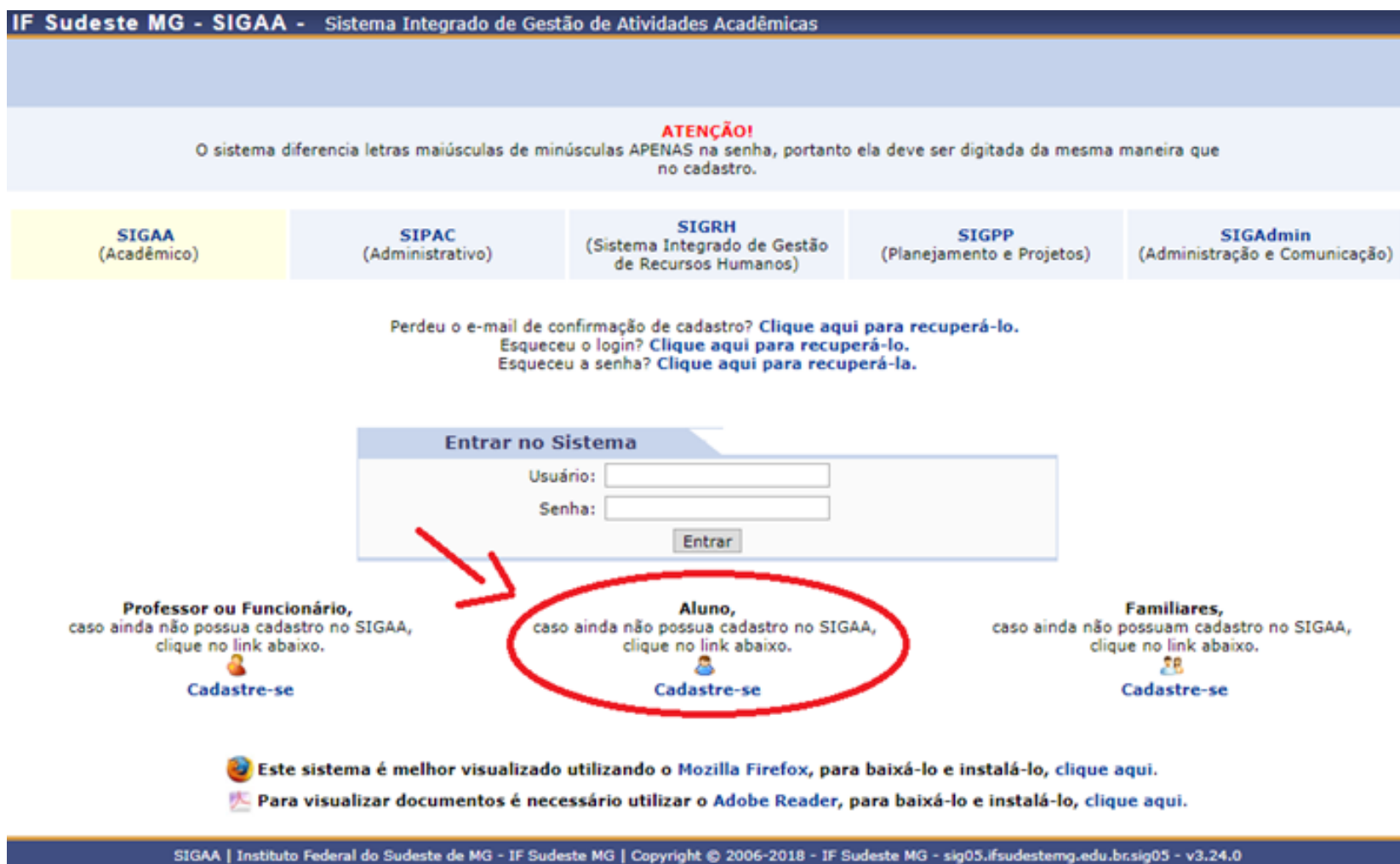
Figura 1: Tela de Acesso SIGAA

1. Acessar o site: https://sig.ifsudestemg.edu.br/sigaa , conforme tela abaixo: