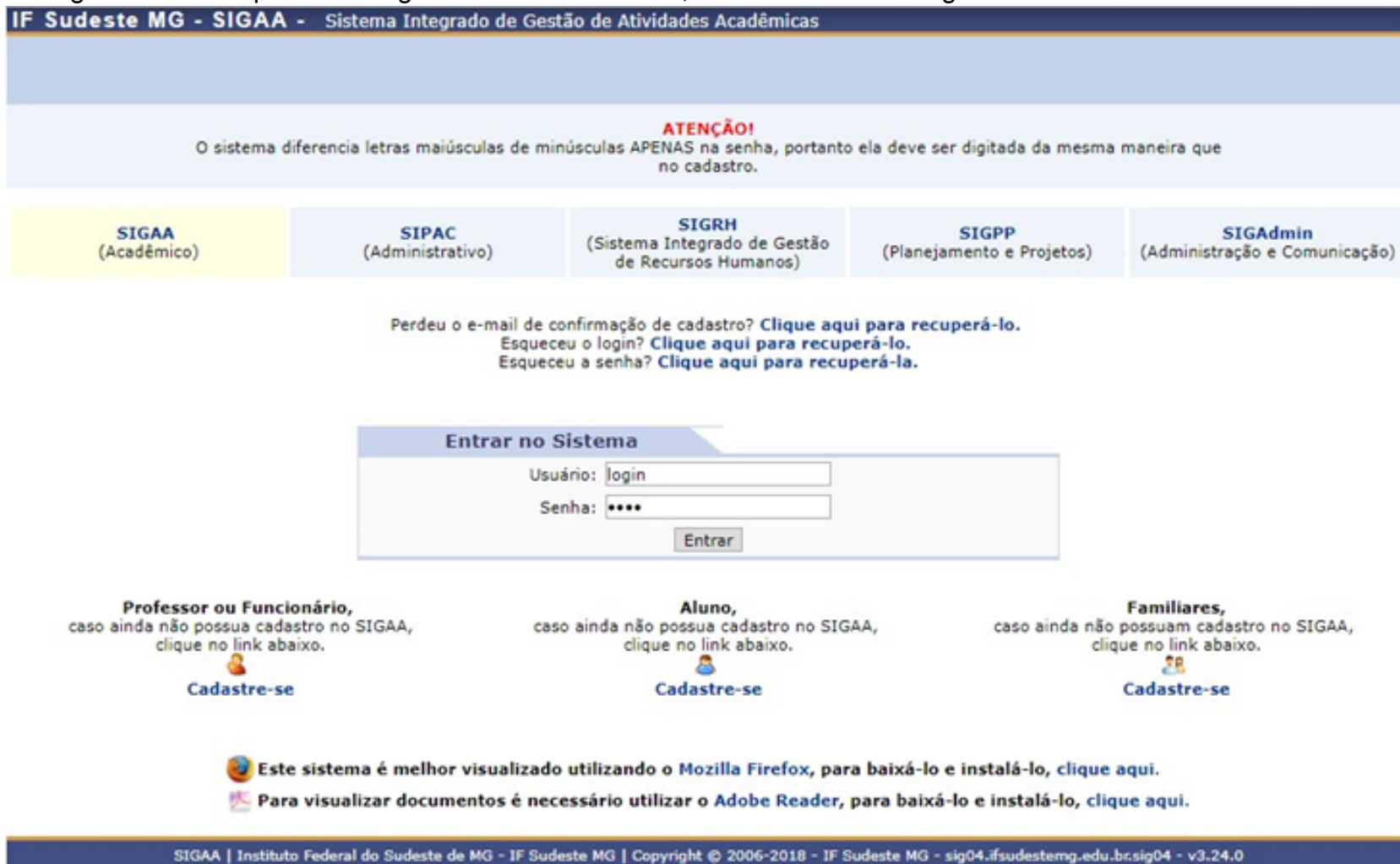
Figura 4: Entrar no Sistema