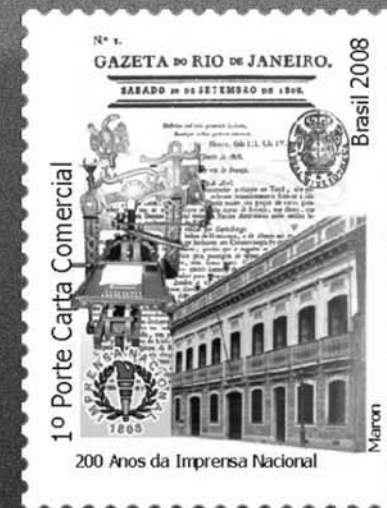
Selo lançado pelos Correios trazendo a sede da Imprensa Régia no Rio de Janeiro, em primeiro plano e, ao fundo, o exemplar nº 1 da Gazeta do Rio de Janeiro