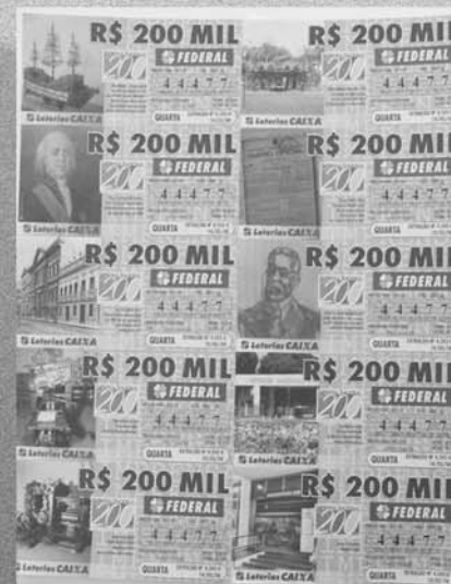
Frações do bilhete da Loteria Federal com imagens históricas relacionadas à Imprensa Nacional Homenagem da Caixa