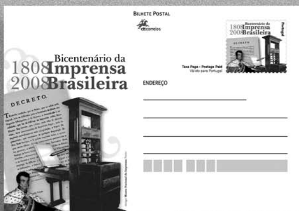
Inteiro Postal lançado no dia 13 de maio na principal estação de metrô – Trindade Homenagem dos Correios e do Museu Nacional de Portugal