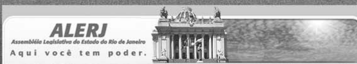
Sessão Solene Extraordinária da Assembléia Legislativa do Estado do Rio de Janeiro Dia 20 de maio de 2008, às 18h 30min