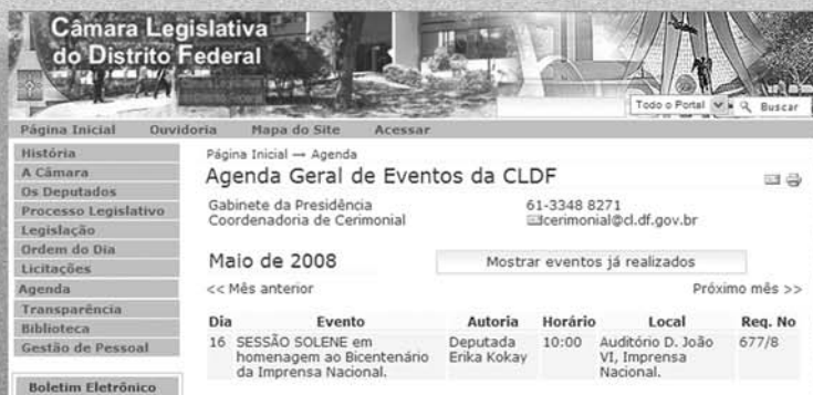
Sessão Solene da Câmara Legislativa do Distrito Federal Dia 16 de maio de 2008, às 10 horas